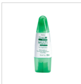
Multipurpose Liquid Glue