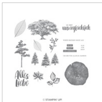
Kraft Der Natur Clear-Mount Stamp Set (German)