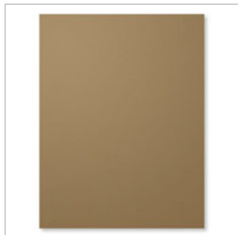
Soft Suede A4 Cardstock