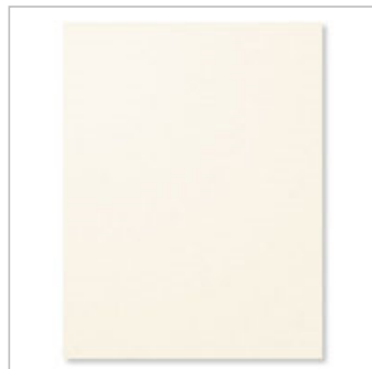
Very Vanilla A4 Cardstock