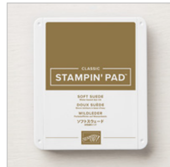
Soft Suede Classic Stampin' Pad