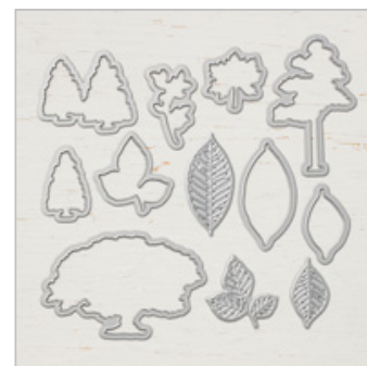
Nature's Roots Framelits Dies