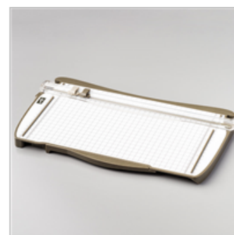
Stampin' Trimmer (Metric)