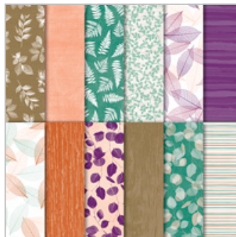
Nature's Poem Designer Series Paper