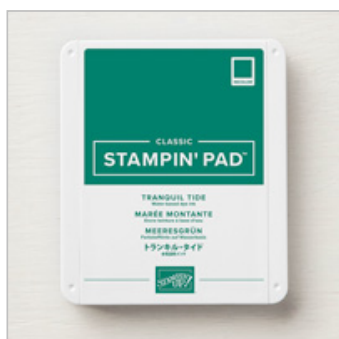
Tranquil Tide Classic Stampin' Pad