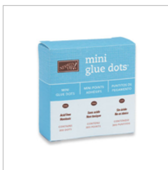
Mini Glue Dots